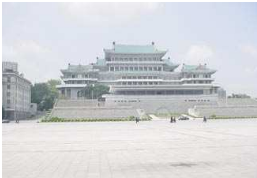
Die Nationalbibliothek in Pjöngjang nennt sich ›Große Studienhalle des Volkes‹ und ist eine Mischung aus Bibliothek und Volkshochschule. Sie soll 30 Millionen Medieneinheiten beherbergen.

Die National Digital Science Library zielt auf einen Informationspool im Bereich Wissenschaft und Technik. In eine ähnliche Richtung wirkt übrigens auch das Koreanische Institut für Wissen