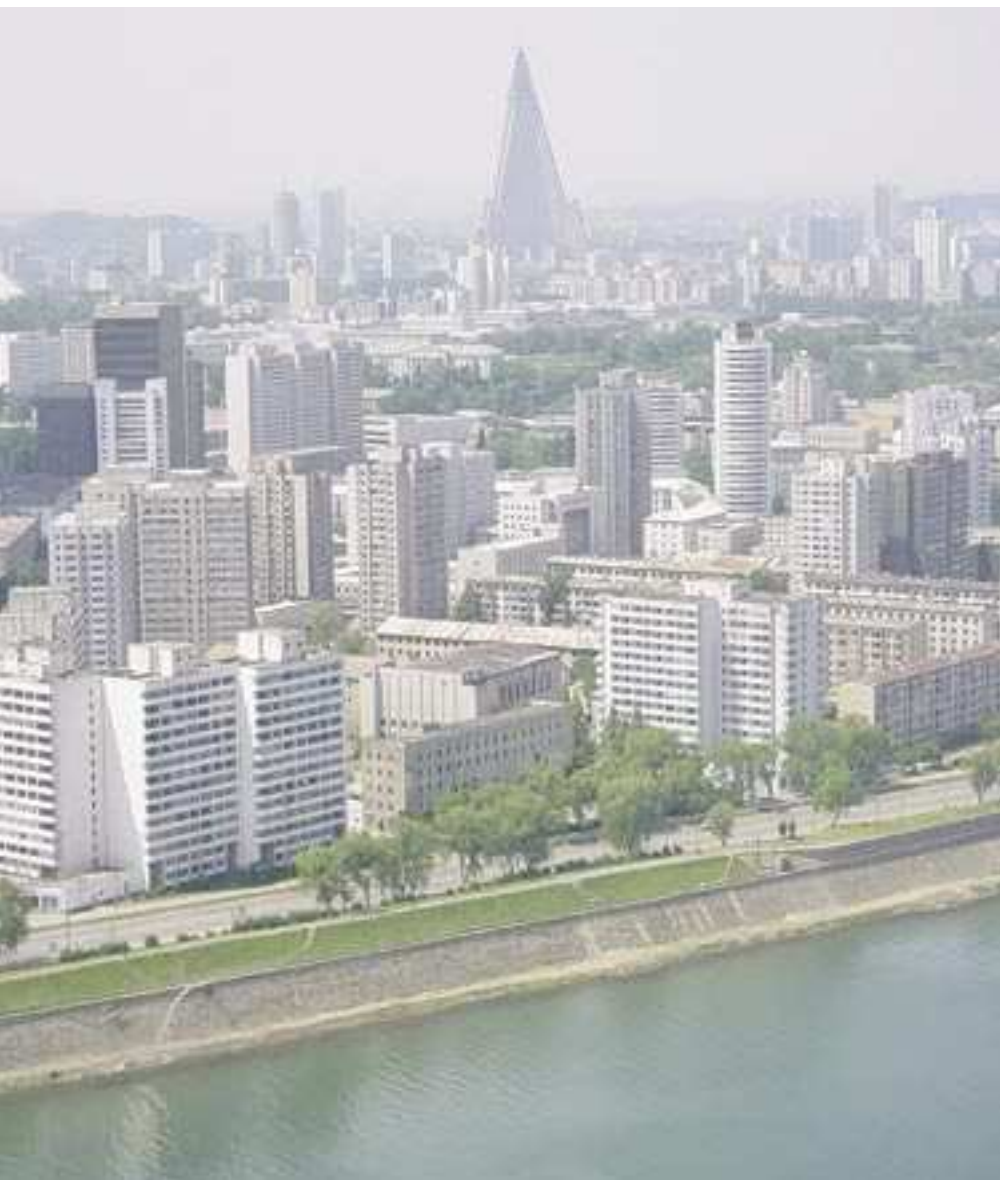
Blick über die nordkoreanische Hauptstadt Pjöngjang

(DDB), Sachgebiet Tausch/Exchange. Koreanische Bücher über Deutschland werden nach Deutschland geschickt; deutsche Bücher über Korea gehen an die Nationalbibliothek in Seoul. Gemäß eines im Dezember 2003 veröffentlichten Artikels in »Korea heute« liegen 3 600 Werke deutscher Schriftsteller in koreanischer Übersetzung in der koreanischen Nationalbibliothek vor.