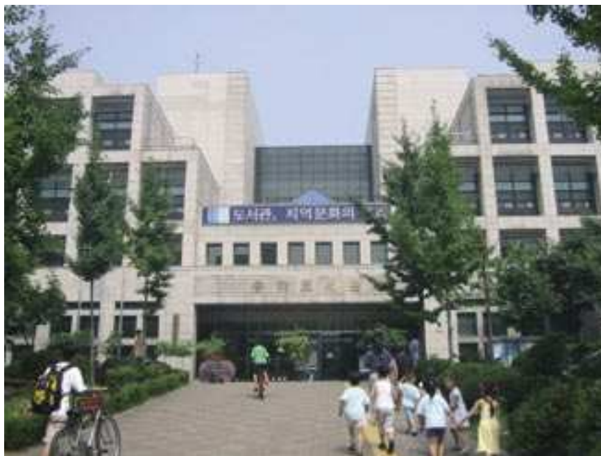
Eine der populärsten Bibliotheken in der südkoreanischen Hauptstadt Seoul: die 1994 gegründete Songpa Public Library

Der Nationalbibliothek obliegt auch der Auftrag der Bibliotheksausbildung, den sie seit 1983 ausführt. Mit der Automatisierung trat notgedrungen eine Veränderung der Ausbildungsinhalte ein. Besonderer Wert wird auf das Bibliotheksmanagement und die Informationstechnologie gelegt. Jährlich besuchen über 2 200 Studenten die von der Nationalbibliothek betriebene bibliothekarische Ausbildungsstätte.