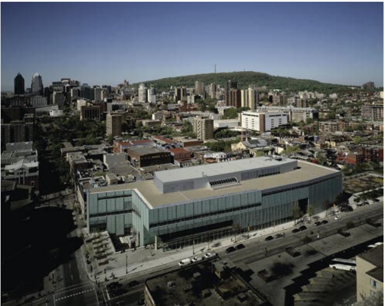
Mitten im Zentrum von Montreal liegt die eindrucksvolle Grande Bibliothèque. Sie ist eine der Hauptattraktionen der Stadt – ein Treffpunkt und Veranstaltungsort für Ausstellungen, Lesungen, Konzerte, Theateraufführungen.

Die Universitätsbibliotheken arbeiten gemeinschaftlich innerhalb der Quebecer Hochschulrektorenkonferenz CREPUQ zusammen (Conférence des Recteurs et des Principaux des Universités du Québec). Der ehrenamtlich tätige Ausschuss der Bibliotheken innerhalb des Gremiums setzt sich aus den Leitern und Leiterinnen der 18 Universitätsbibliotheken Quebecs zusammen. Seine Aufgabe besteht darin, durch Kooperation die Erweiterung der Bestände und der Informationsangebo-