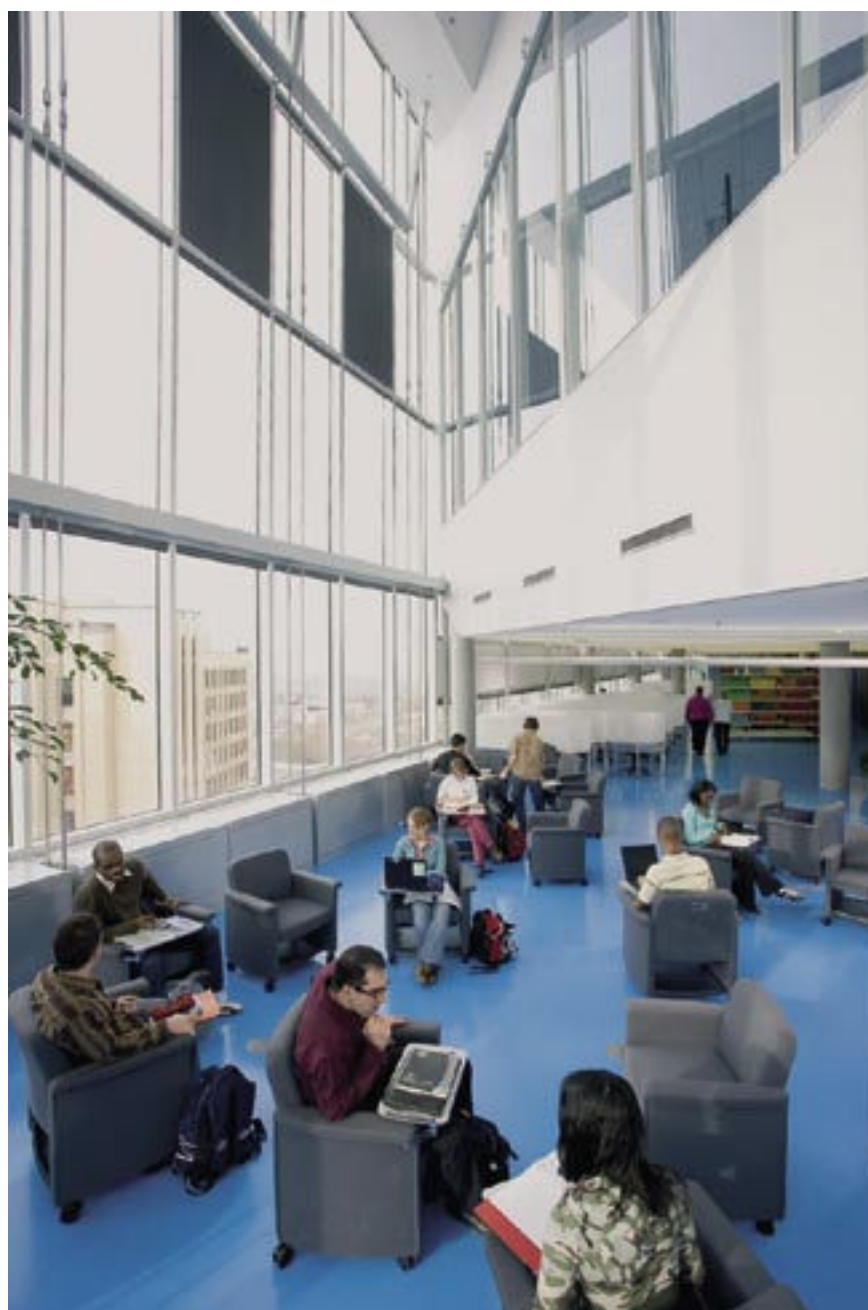
Die Bibliothek der École Polytechnique ist ein Beispiel für zwei neue Tendenzen der Bibliotheken Quebecs: sich für die Umwelt einzusetzen und ein intellektuelles Forum zu sein.

miteinander verknüpft und bieten den Benutzern somit einen umfassenden Service. Man sieht deutlich, wie sehr sich die Mitarbeiter aus den verschiedenen Tätigkeitsbereichen eine enge Zusammenarbeit wünschen, um von den speziellen Kenntnissen der anderen zu profitieren. Bei der Ahnenforschung zum Beispiel haben die Benutzer mittlerweile Zugriff auf mehrere Datenbanken und können Suchanfragen gleichzeitig in beiden Online-Katalogen, IRIS (Bibliothek) und