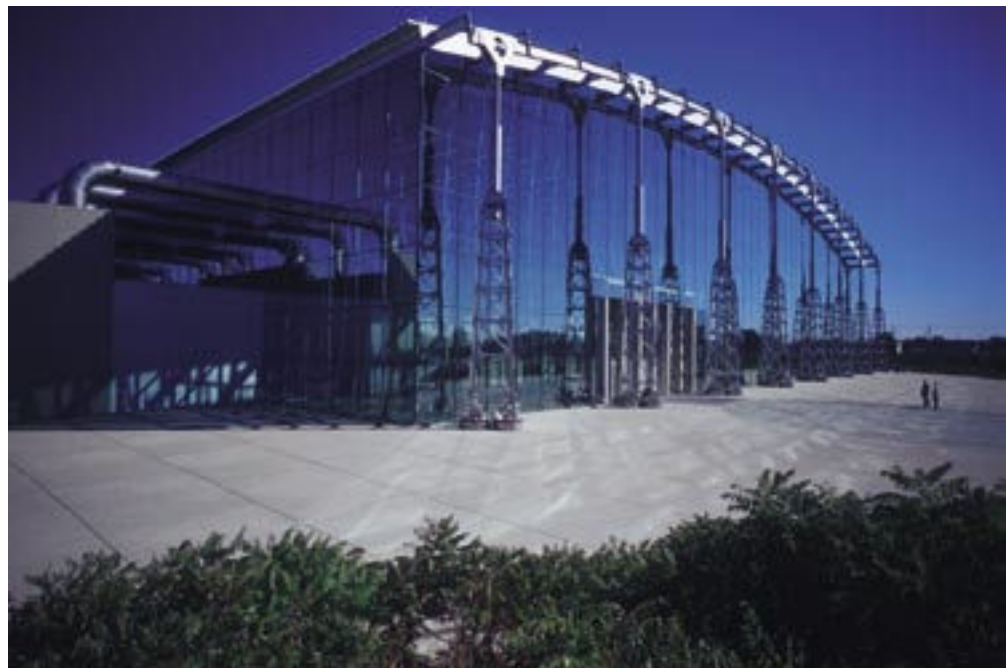
Die »Library and Archives Canada«, die aus der Fusion von Nationalbibliothek und Nationalarchiv hervorging, verfügt über doppeltes Finanzvolumen und über mehr politischen Einfluss als ihre Vorgängerinstitutionen.

Die gerade erst im Herbst 2005 eingeweihte Bibliothek der École Polytechnique erstreckt sich über die beiden obersten Etagen der neuen Pavillons der Hochschule und ist ein gutes Beispiel für zwei neue Tendenzen der Bibliotheken Quebecs, nämlich sich für die Umwelt einzusetzen und ein »intellektuelles Forum« zu sein. 8 Die Lassonde-Pavillons, in denen sich die Bibliothek befindet, sind in der Tat schon bereits mehrere Male für Umweltfreundlichkeit ausge-