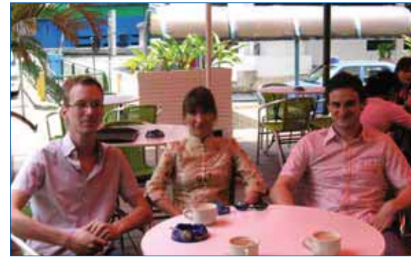
Das GI-Team Information und Bibliothek