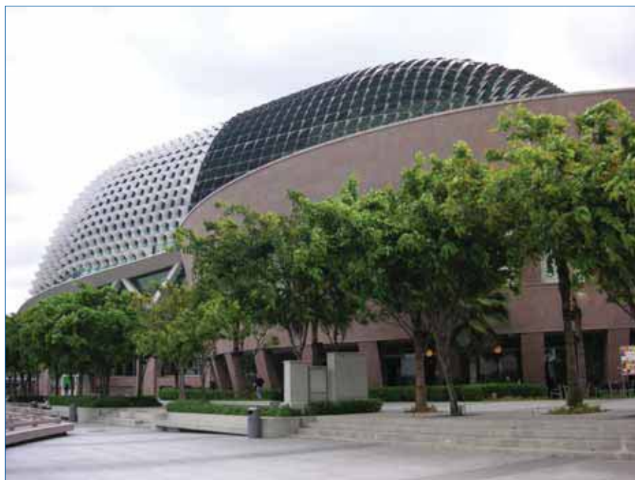
Einfahrt zum Campus der NTU Singapur

Die beiden Hauptverantwortlichen Abdus Sattar Chaudhry und Christopher Khoo 5 von der Division of Information Studies der NTU stellten mit ihren zahlreichen Helfern ein beeindruckendes Programm 6 mit sechs Workshops und rund 30 Sessions auf die Beine.