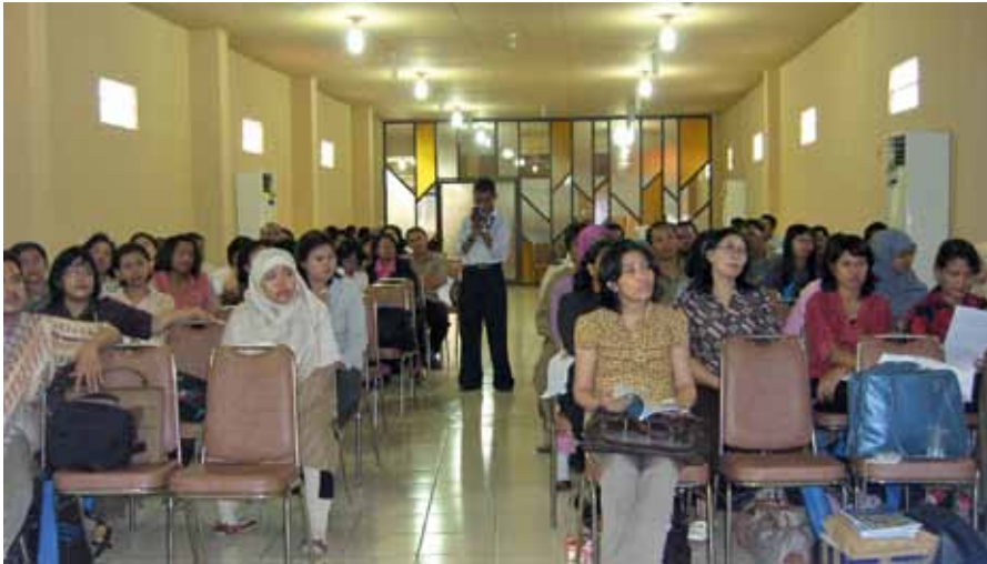
Seminarraum der Universitas Kristen Petra in Surabaya

ten Petra in Surabaya, einer Dreimillionen-Stadt im Osten der Insel Java, gehalten. Die Universität ist eine von rund 30 christlichen, mehrheitlich protestantischen Hochschulen des Landes, in dessen Veranstaltungszentrum Petra Toga Mas das Goethe-Institut die oben genannte Ausstellung wenige Tage zuvor eröffnet hatte. Die Vorträge fanden im Rahmen des Seminars „Freedom for Unity“ statt und sahen auch ein Koreferat zur indonesische Erfahrung unter dem Titel „Indonesian Libraries and Library Education in the Reform Era“ vor. In einer weiteren Begleitaktion setzten sich Studenten auf künstlerische Weise, nämlich mittels der landestypischen Batikkunst, mit dem The-