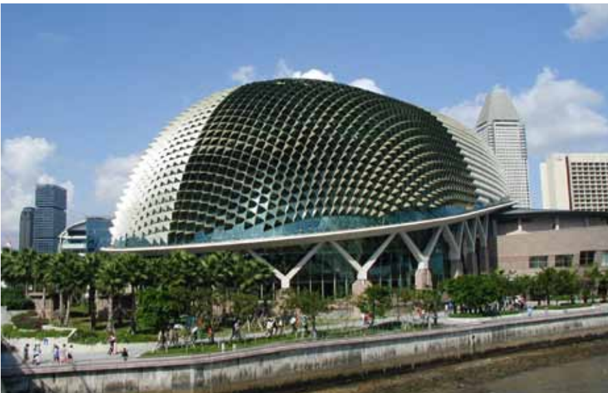
Veranstaltungszentrum am Singapore River mit Library Esplanade

tuts eher den Charakter einer Public Library aufweist, besitzt die Bibliothek des Erasmus-Huis, des niederländischen Pendantes zur deutschen Kultureinrichtung, auch einen größeren Bestand an wissenschaftlicher Literatur. Im Erasmus-Huis, innerhalb der niederländischen Botschaft gelegen,