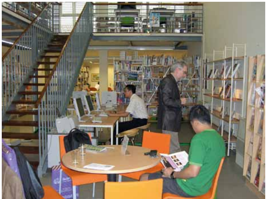
Bibliotheks- und Informationszentrum des Goethe-Instituts Jakarta

Gedenkveranstaltungen gab es auch in Südostasien, zum Beispiel in Indonesien, wo das Goethe-Institut Jakarta unter dem Titel „1949 – 1989 – 2009: Einblicke in 60 Jahre deutsche Geschichte“ eine Ausstellung konzipierte. Sie wurde zunächst in der indonesischen Hauptstadt, dann in Bandung, wo das Goethe-Institut eine Außenstelle betreibt, und schließlich in der ostjavanischen Stadt Surabaya gezeigt. Warum am Wandel von einer diktatorischen zu einer demokratischen Gesellschaft, wie er nach 1989 in der DDR stattfand, gerade in Indonesien lebhaftes Interesse besteht, erklärt sich aus der jüngsten Geschichte dieses Landes. Ein Jahr nach Ausbruch der großen Asienkrise, im Frühjahr 1998, wurde der indonesische Diktator General Suharto, der 1965 durch einen Putsch an die Macht gelangt war, in dessen Verlauf mindestens eine halbe Million Menschen ermordet wurden, gestürzt. Anders als in der DDR verliefen die das Ende der indonesischen Diktatur einleitenden Demonstrationen keineswegs gewaltfrei: über 1.000 Menschen starben,