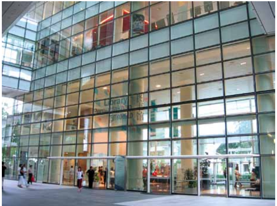
Eingang des Hauptgebäudes der Nationalbibliothek Singapurs

Obwohl das ansprechende Bibliotheksgebäude erst 1982 eröffnet wurde, wird es im nächsten Jahr durch einen Neubau ersetzt, der einen Maulwurfshügel gleicht, aus dem schlanke Türme herausragen. Die Architektur folgt mit diesem spektakulären Entwurf einem ökologischen Ziel, denn das mit Gras bewachsene Dach und ein besonderes Bewässerungssystem sorgen für eine natürliche Klimatisierung ohne ozonschädliche Substanzen. Dieses Vorhaben mag ein Beleg für die hohe Meinung der Universität von ihrer Bibliothek als „heart of the university“ sein, was wiederum mit dem Selbstverständnis der Bibliothek als „Crystal of Knowledge“ korrespondiert.