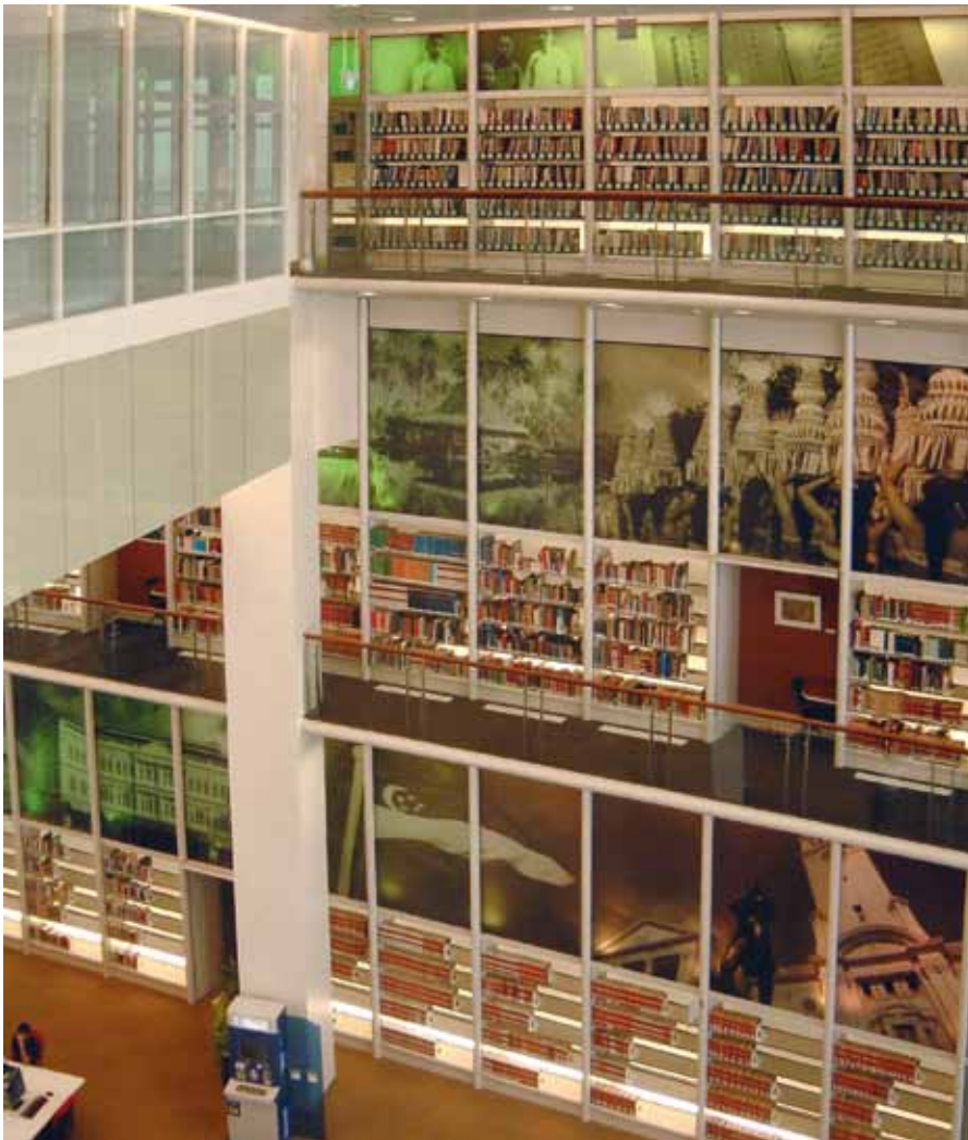
Level 11 der Nationalbibliothek Singapurs mit Southeast Asian Collection und e-Kiosk