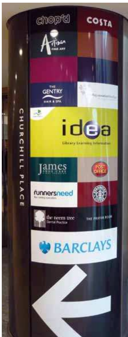
Litfasssäule im Einkaufs- und Bankenzentrum der Canary Wharf: Wer hat das größte Logo?

Ebenso sind in England die fragwürdigen »deutschen« Sicherheitskonzepte, nach denen keine Taschen und Rucksäcke in Bibliotheken mitgenommen werden dürfen, unbekannt – das Gleiche gilt für Museen. Explizit und bewusst vermieden