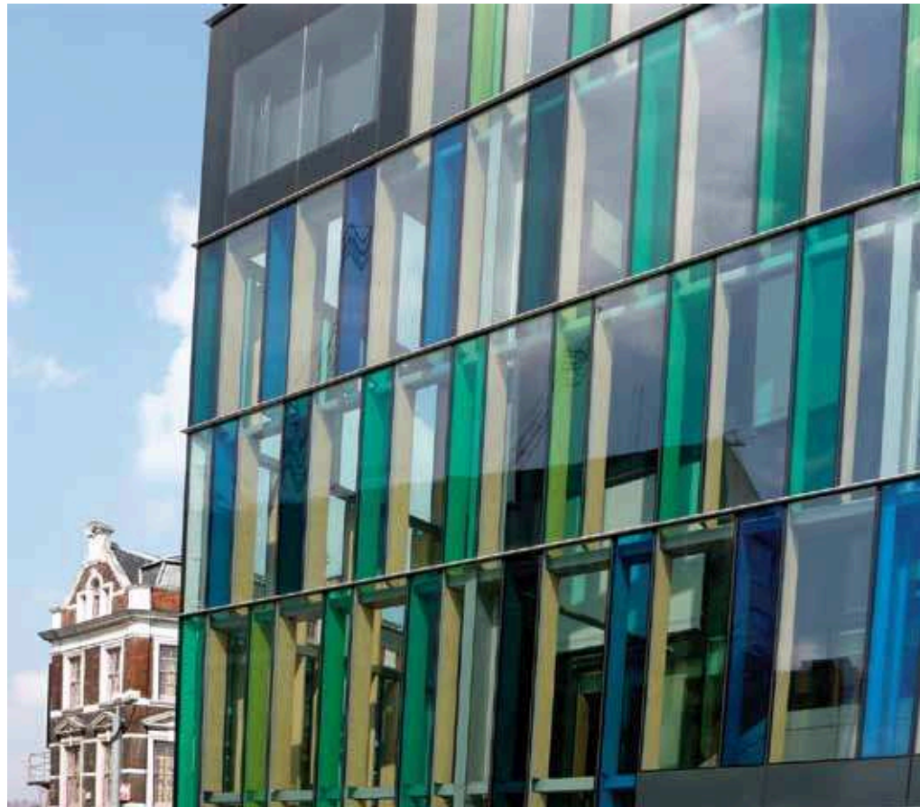
Die Idea Stores des Londoner Architekten David Adjaye haben mit ihren blau-weiß-grünen Glaskuben einen hohen Wiedererkennungseffekt.

Primäre Ziele sind einerseits die Aufwertung des bis in die Neunzigerjahre eher vernachlässigten East Ends, andererseits Lern- und Bildungsangebote für die in diesem Stadtteil lebenden Migranten. Rund 60 Prozent der Bewohner von Tower Hamlets sind nichteuropäischer Herkunft, ein Drittel stammt aus Bangladesch. Mehr als 50 Sprachen sind zu hören.