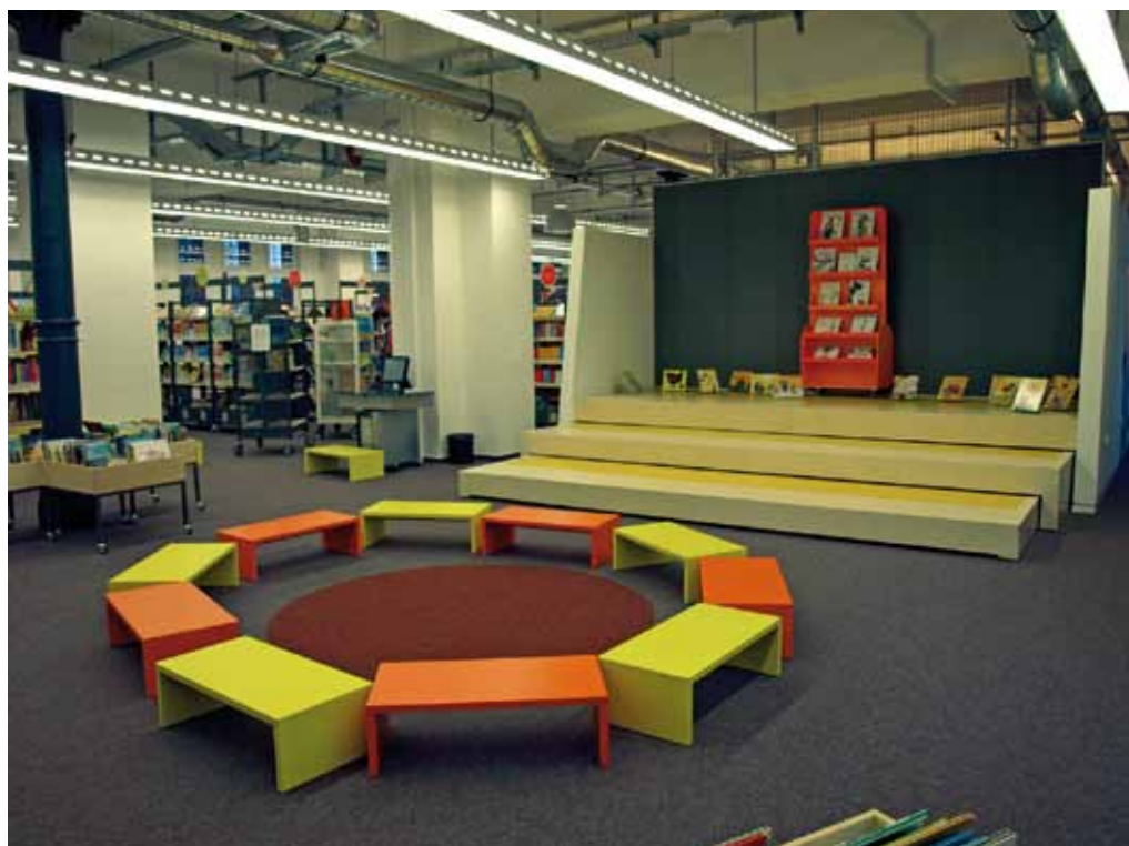
Der zur Kinderbibliothek hin offene Marktplatz erlaubt mit seinem flexibel ausziehbaren Podest eine vielfältige Veranstaltungsarbeit.

Die räumlichen Bedingungen am Grindelberg ließen eine Weiterentwicklung der Kinderbibliothek, die sich seit ihrer