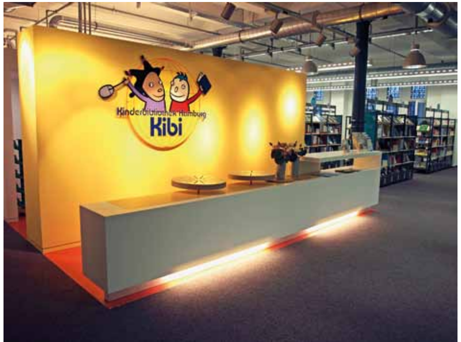
Die Rezeption – farblich auf die gesamte Bibliothek abgestimmt – heißt die Kinder willkommen und hält zahlreiche Informationen rund um die Bibliothek bereit.

Auch die Zusammenarbeit mit der ekz, die für die Regalausstattung zuständig war, funktionierte ausgezeichnet. Sie konzipierte eigens auf die individuellen